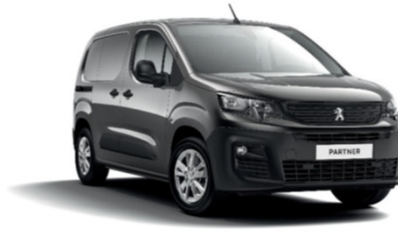
MOVL | Platinumin harmaa (metalliväri)