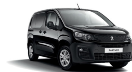
POXY | Onyxin musta (erikoispastelliväri)