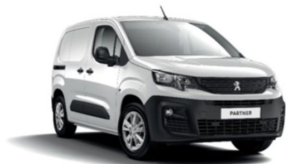
POPR | Ice White valkoinen (perusväri)