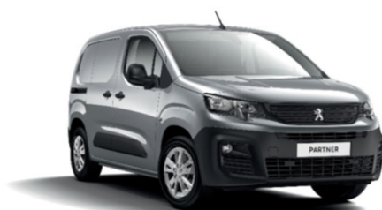
MOF4 | Artensen harmaa (metalliväri)